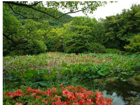
芙蓉沼とサツキツツジ