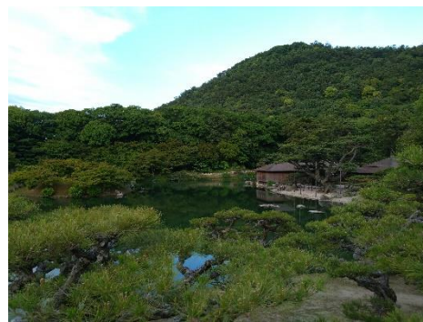
渚山から望む掬月亭